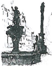
Rynek Fontanna z Neptunem