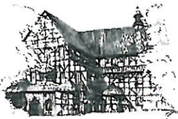
Kościół Pokoju pw. Św. Trójcy Wpisany na listę UNESCO